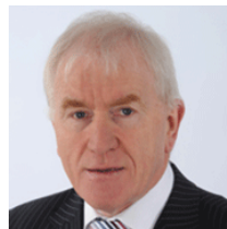
Séamus Ó Duibhneacháin T.D. An tAire Ealaíon, Oidhreacht agus Gaeltachta

Agus an Chairt seo á dréachtú againn, glacaimid leis freisin go bhfuil ceangal bunúsach idir an t-oideachas ealaíon agus na healaíona san oideachas.