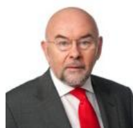
Ruairí Quinn T.D. An tAire Oideachais & Scileanna